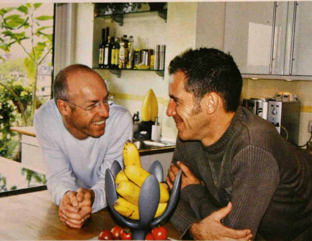
Der Streit ums Geld ist fast schon ein lieb gewonnenes Ritual für Rüdiger (li.) und Dirk.